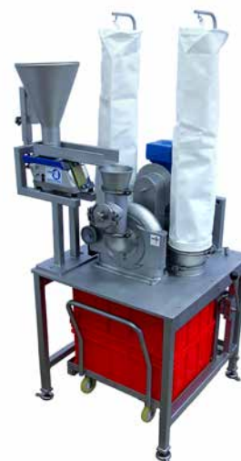
REKORD A Настольная мельница для малых порций