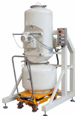
REKORD B-ex Универсальная компактная мельница