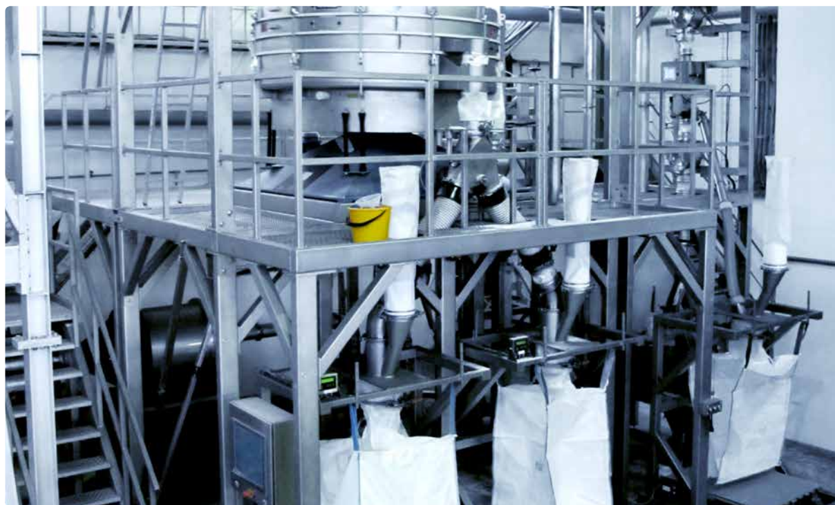
REKORD C – размольная установка для пищевых фосфатов