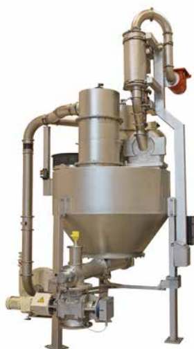
REKORD BT-ex Универсальная размольная установка