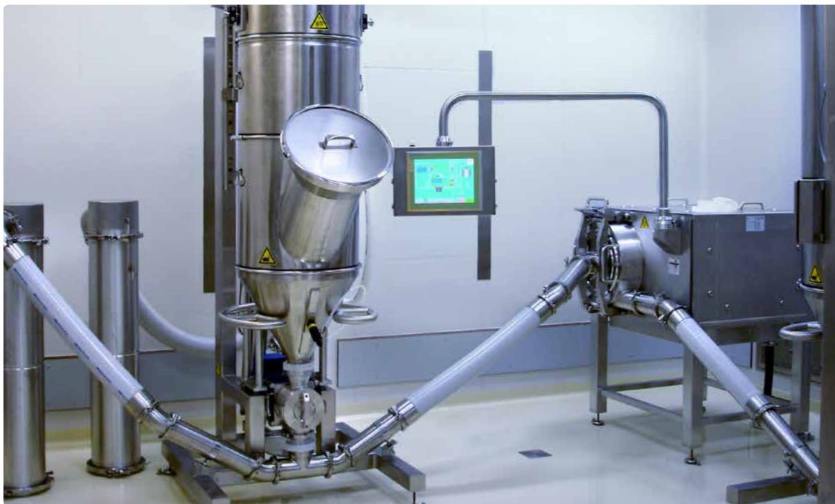
REKORD 315 GMP – установка тонкого помола для сред клеточных культур