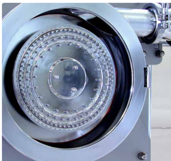
REKORD 224 GMP – штифтовая мельница