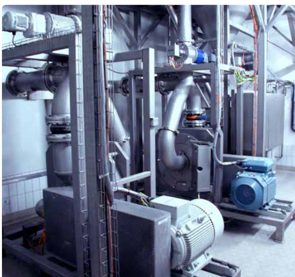
REKORD 630 GMP – установка тонкого помола для лактозы