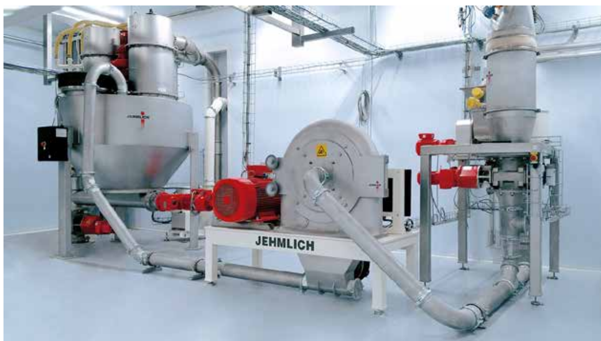
Abb.: REKORD-Zuckermahlanlage mit integriertem Puderzuckerbehälter, Puffervolumen 1.500 l, mit Rührwerk und Austragschnecke