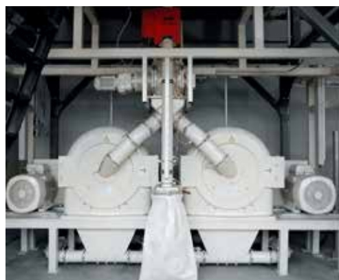
REKORD C Kombination für Lebensmittelproduktion