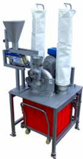
REKORD A Tischmühle für kleinere Chargen