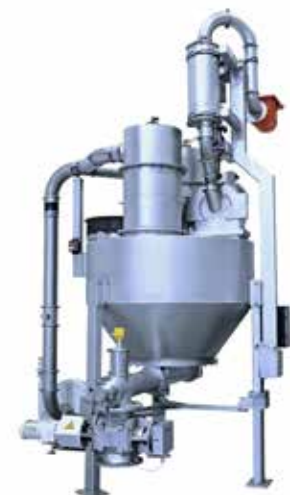
REKORD BT-ex ATEX-konforme Universalmahlanlage