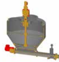
Pufferbehälter mit Rührwerk