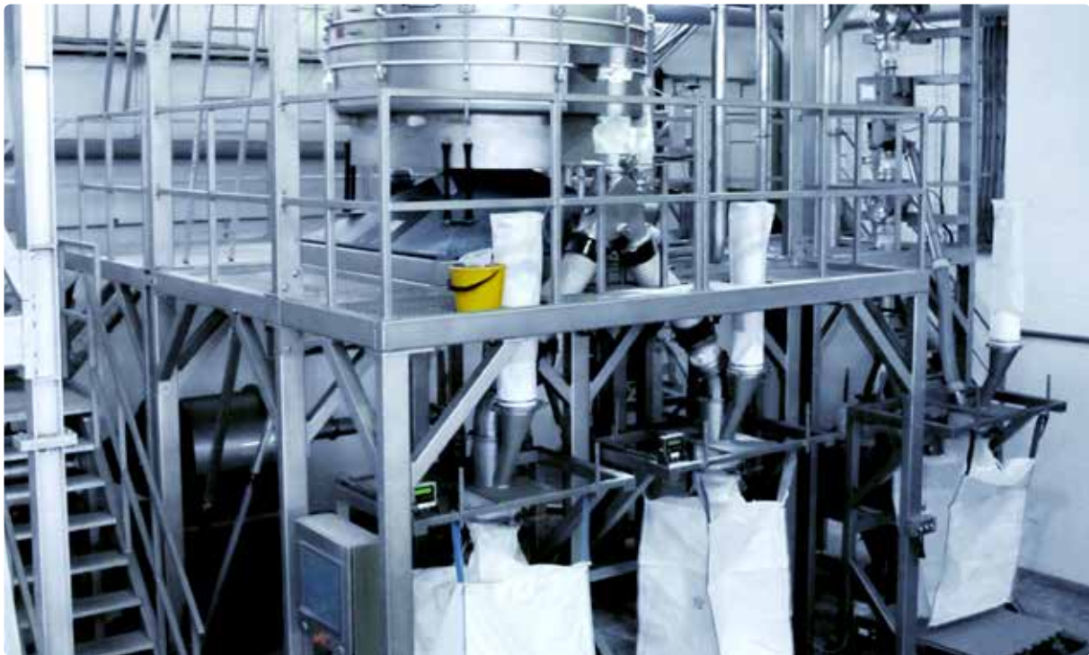
REKORD C Mahlanlage für Lebensmittelphosphate