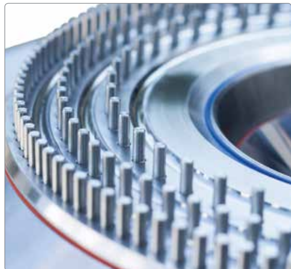
Stiftscheibe REKORD 315-GMP