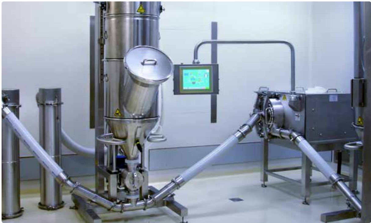
REKORD 315 GMP-Feinmalanlage für Zellkultur-Nährmittel